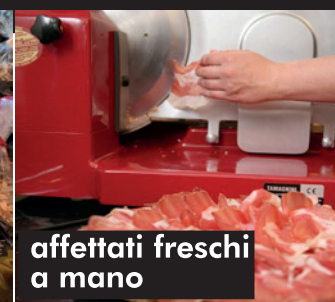
affettati freschi a mano

Grande assortimento di colombe e uova pasquali