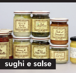
sughi e salse